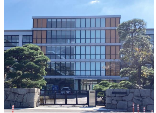
【香川県立丸亀高校】 約1,000m