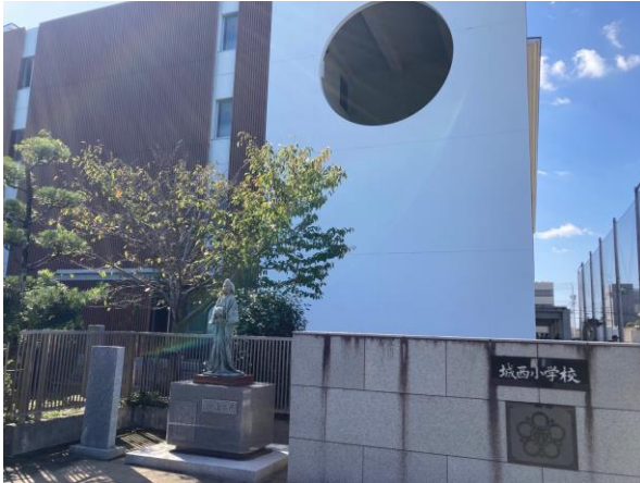
【丸亀市立城西小学校】 約1,300m