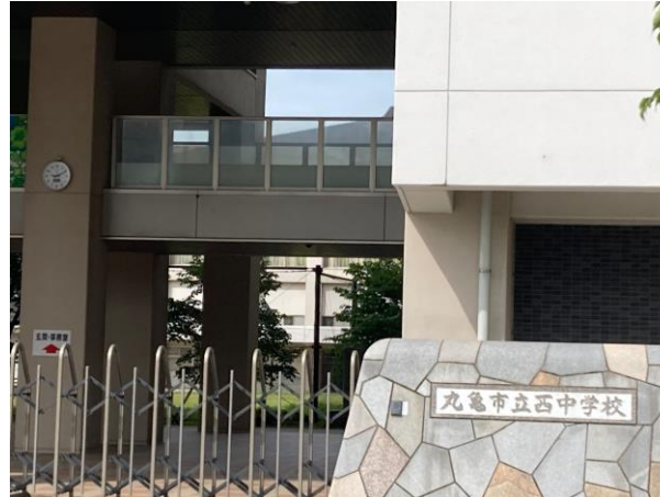
【丸亀市立西中学校】 約1,500m