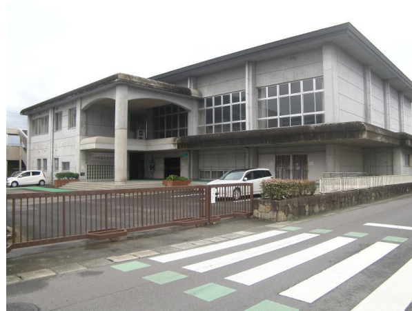
善通寺市立東部小学校 約450m