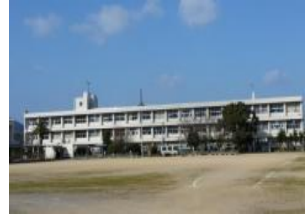
善通寺市立東部中学校 1,600m