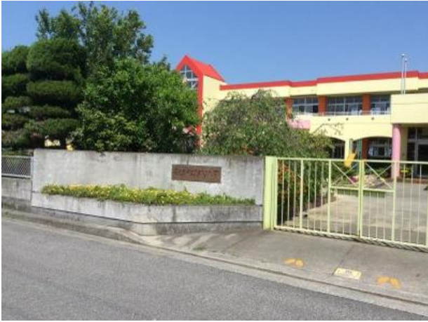
善通寺市立東部幼稚園 約200m