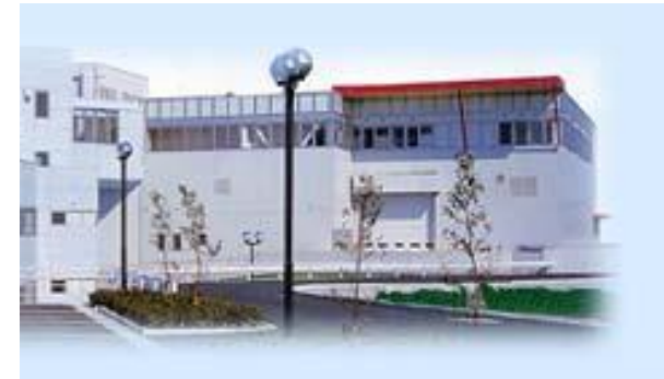
未来クルパーク21 約1,600m