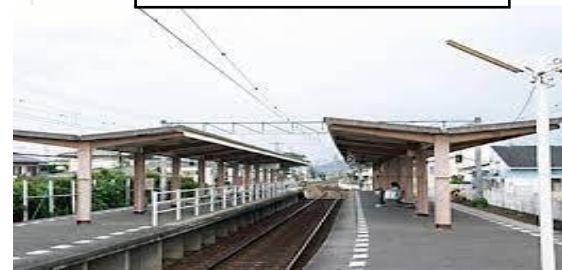
香川町大野マルナカ店約800m